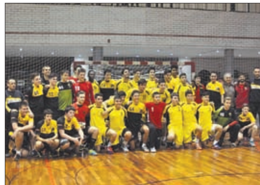
Los cadetes de la Selecció y el Pardinyes

El Pavelló Municipal de Pardinyes acogió ayer uno de los encuentros amistosos que la Selecció Catalana de balonmano en categoría cadete está realizando durante este puente festivo como preparación para el próximo Campeonato de España de selecciones territoriales. El numeroso público presente en