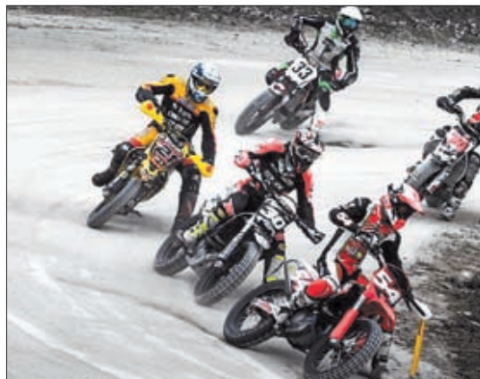
Imagen de una de las espectaculares carreras