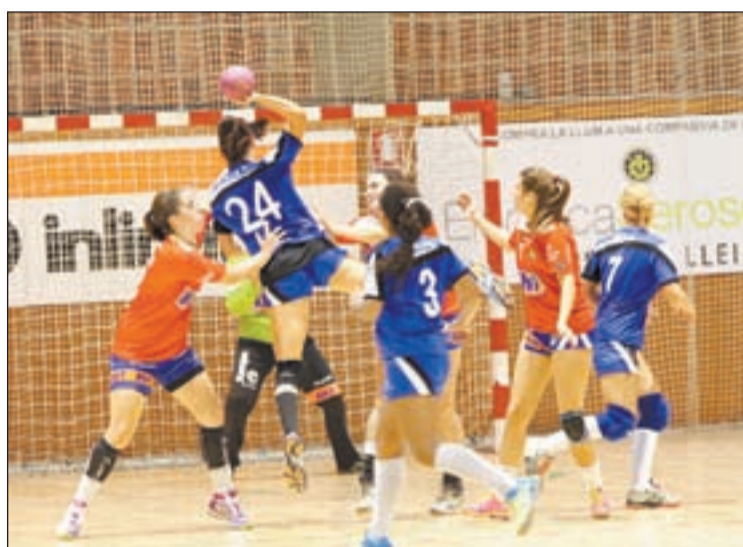
Las leridanas debutan en una pista complicada

Para este partido, Vujasinovic no podrá contar con Imma Soto ni Eva Guirado por motivos laborales, pero si serán de la partida el resto de jugadoras azules, in-