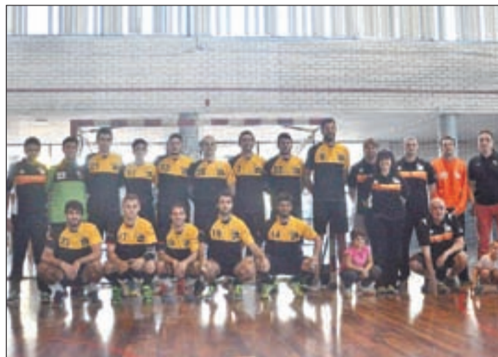
El equipo llega con tres bajas

El Handbol Lleida Pardinyes vuelve a la Primera Estatal después de 12 años esta tarde (19.15 horas) en la pista del Gavà, un experimentado rival que la pasada temporada finalizó en la zona media de la categoría.